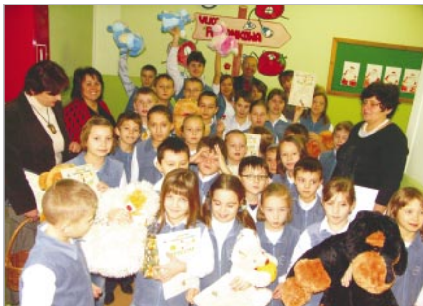
Przy ulicy Poziomkowej

Autorzy wybranych nazw uliczek otrzymali również dyplomy.