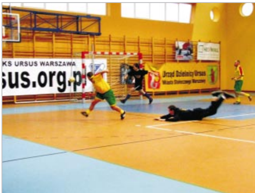
Akcja pod bramką

Szczególne podziękowania należą się firmie Ebejot, która poprzez mocne zaangażowanie się finansowe w Klub Sportowy Ursus Warszawa ufundowała słodczyce dla najmłodszych oraz sprzęt sportowy. Dobra praca nowego zarządu klubu oraz pomoc ze strony lokalnych firm jak i Urzędu Dzielnicy Ursus pozwalają mieć nadzieję, że przyszły rok będzie bardzo dobry pod względem organizacyjnym jak i sportowym.