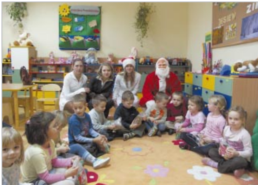
Mikołaj w przedszkolu

Wydział Kultury Urzędu Dzielnicy Ursus m. st. Warszawy oraz Chór Cantate Deo serdecznie zapraszają do udziału w przesłuchaniach.