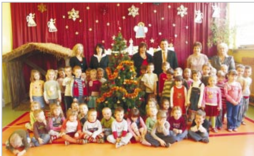
Wspólne zdjęcie ze sponsorami

Już od dawna Bank Zachodni WBK jest otwarty na potrzeby najmłodszych. – Najważniejszym dla nas jako banku jest dziecięcy uśmiech. Razem z Fundacją „Bank Dziecięcych Uśmiechów” chcemy być zawsze blisko dzieci i nieść im