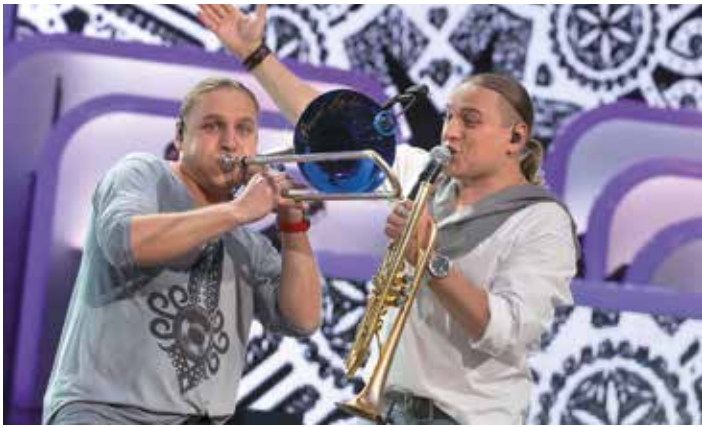
Fot. Mirosław Sosna