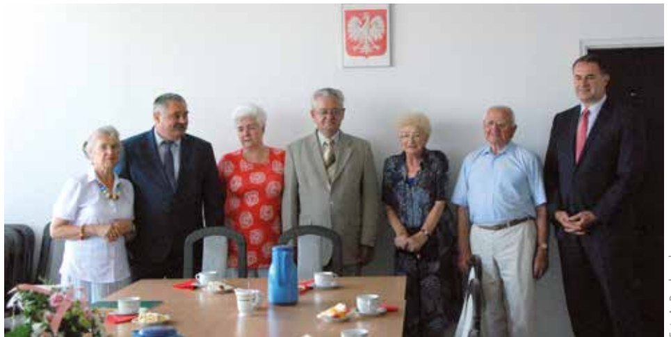
Jubilaci z przedstawicielem Zarządu Dzielnicy

Medal za Długoletnie Pożycie Małżeńskie ustanowiono jako nagrodę dla osób, które przeżyły 50 lat w jednym związku małżeńskim. Został ustanowiony ustawą z dnia 17 lutego 1960 o orderach i odznaczeniach, a włączony do obecnego systemu odznaczeń państwowych ustawą z 16 października 1992