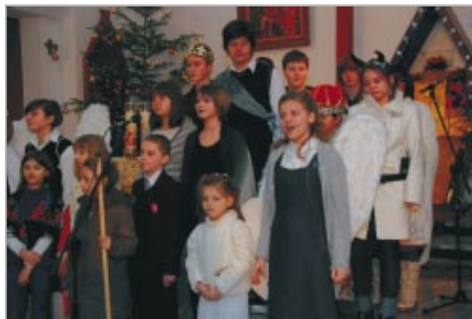
Grupa dzieci i młodzieży reprezentująca zespół

Tradycja ta zobowiązuje nas do kontynuowania pracy z grupą dzieci i młodzieży, która staje się reprezentacyjnym