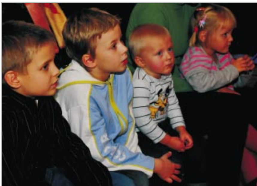
Przedszkolaki szybciej do szkoły

W sejmie trwają prace nad ustawą wprowadzającą obniżenie wieku szkolnego. Z obecnego kształtu dokumentu wynika, że ten proces może rozpocząć się od 1 września 2009 roku. Reforma zakłada podzielenie tego procesu na trzy etapy.