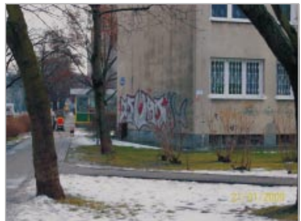
Graffiti na budynku przy ul. Dzieci Warszawy

Usunięcie ich wiąże się z kosztami. Ale jaką mamy pewność, czy po usunięciu malunków nie powstaną w tym samym