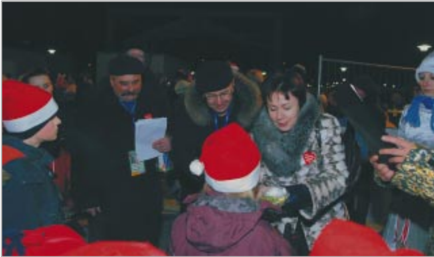
Kwesta Zarządu Dzielnicy