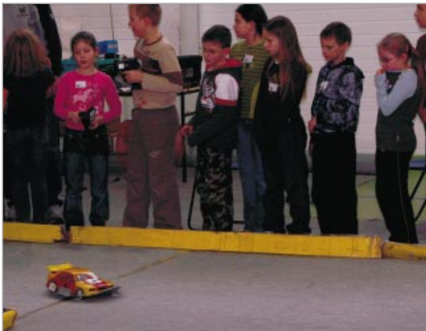
Zabawa samochodzikami zdalnie sterowanymi

ście – mistrzowi Olimpijskiemu na 3 000 m z przeszkodami z Rzymu w 1960 roku, największemu powojennemu długodystansowcowi Polski, dwukrotnemu rekordziście świata, dwukrotnemu Mistrzowi Europy, 28 – krotnemu rekordziście Polski na dystansach od