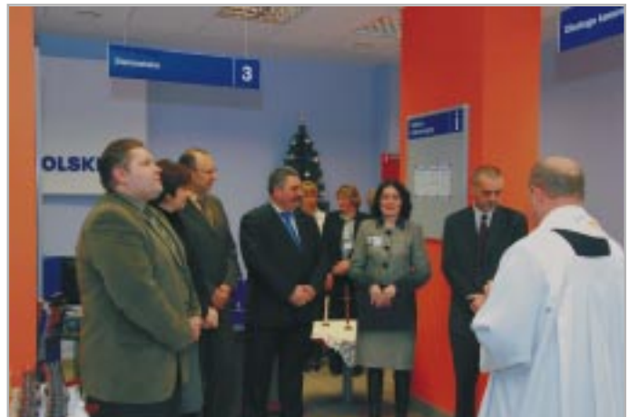
Otwarcie nowego banku PKO BP