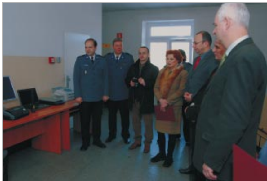
Uroczyste przekazanie sprzętu