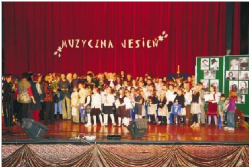
Artyści Muzycznej Jesieni

Włochy oraz Wydziałem Kultury i Promocji Dzielnicy Ursus m. st. Warszawy.