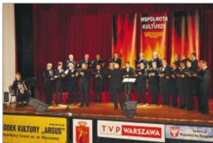
Zespół Muzyki Cerkiewnej