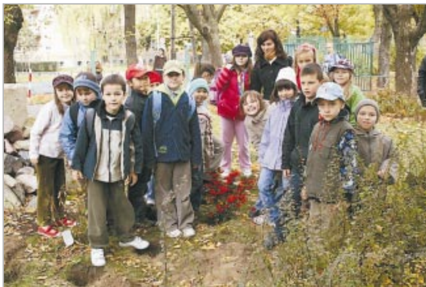
Z archiwum szkoły

wa” po raz piąty. Dzięki zaangażowaniu uczniów, rodziców i nauczycieli w