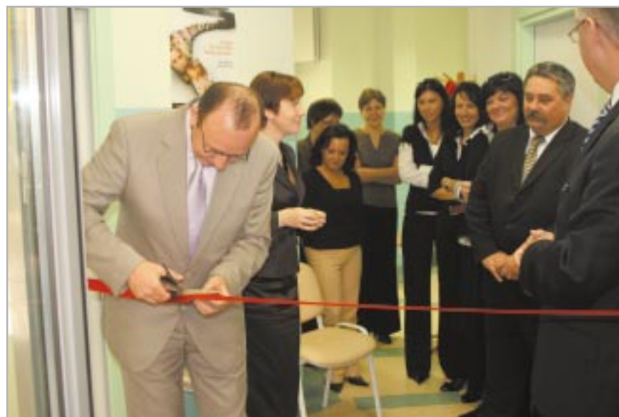
Uroczyste przecięcie wstęgi

naszej dzielnicy poradnia medycyny sportowej. Dzieci i młodzież z klas sportowych oraz klubów znajdą na miejscu lekarza, który po wykonaniu niezbędnych badań oraz konsultacji wyda w ramach ubezpieczenia w Narodowym