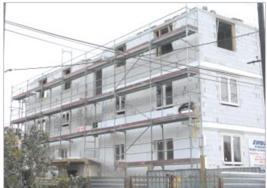
Aktualny postęp prac