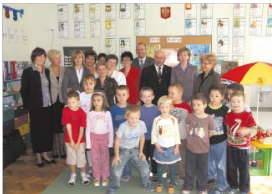
Z dziećmi z przedszkola integracyjnego

prowadzonym we wszystkich grupach wiekowych, a w niektórych brali nawet czynny udział. Dzieci z właściwą sobie bezpośredniością chwyciły Kuratora za