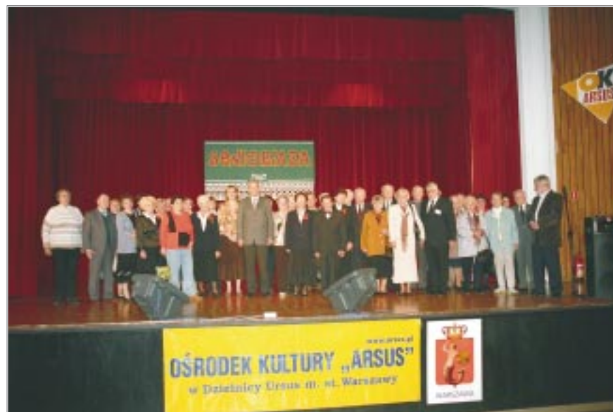
Wspólne zdjęcie z seniorami

„Arsus” z udziałem dzielnicowych organizacji społecznych zorganizowali Senioriadę podczas, której wystąpiła