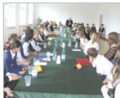
Podczas spotkania z młodzieżą

W związku ze zbliżającym się Dniem Edukacji Narodowej wręczone zostały