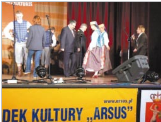
Warsztaty tańców litewskich

W następnym roku zapraszamy na „Wspólnotę” romsko-czeską. Naszym zamiarem realizacja „Wspólnoty w kulturze” w dwóch wymiarach – promocja i poznawanie polskich mniejszości na-