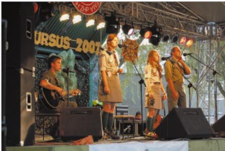
Na harcerskiej estradzie

udział wzięły również zespoły: „Syrena” ze Szczepu 273 WDHiGZ „Mazowsze” oraz „Błyskawica” z Domu