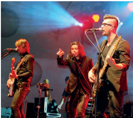
Gwiazda wieczoru - Zespół PECTUS