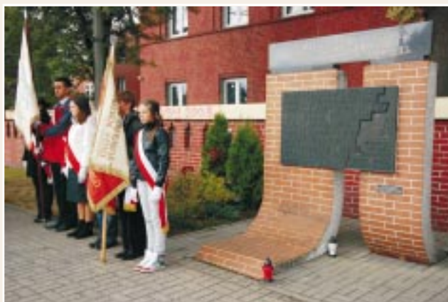
Tędy przeszła Warszawa

latach 1980-1989 koło podlegało Zarządowi Dzielnicowemu ZBoWiD Warszawa-Ochota i było jednym z najliczniejszych kół dzielnicy. Okres ten był bardzo trudny dla prowadzenia koła. Mimo to dzięki aktywowi koła wiele spraw udało się załatwić pozytywnie. Trzeba również dodać, że działalność Koła ZBoWiD w Ursusie pozostawiła po sobie widoczny dorobek, dzięki aktywności i współpracy członków z różnych środowisk kombatanckich. Największa liczba członków zwyczajnych w Kole i aktywistów z różnych środowisk kom-