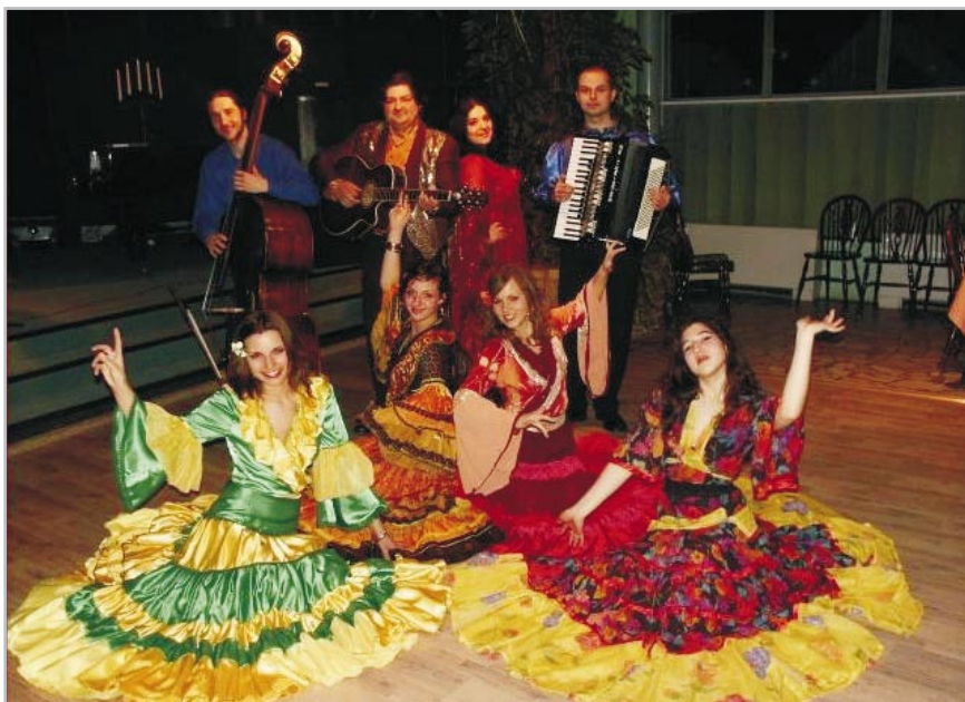
Zespół Vanessa i Sorba

W piątek, 26 października o godz. 17 odbędzie się wernisaż wystawy Mar-