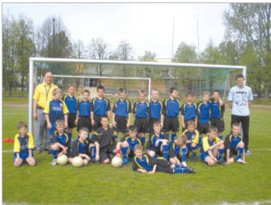
Dzieci z rocznika 1996

pinos 4:1 i pewnie zmierzają po awans do klasy „A”, co jest celem numer 1 dla drużyny Zdzisława Stanulewicza. Nasze młodzieżowe drużyny rozpo-