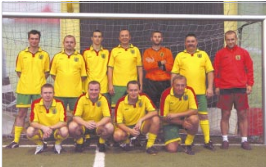
Nasza samorządowa drużyna

nak do przeciwnika, który wykazał się lepszym przygotowaniem kondycyjnym i zaaplikował naszym 4 gole. W meczu o trzecie miejsce spotkaliśmy się z Mo-