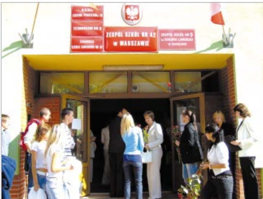
Młodzież wita przedstawicieli Zarządu Dzielnicy

- W tym roku po raz pierwszy od wielu lat wszyscy chętni znaleźli miejsca w