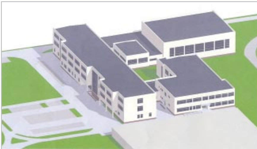
Projekt kompleksu przy ul. Dzieci Warszawy 42

ciągę do budynku przy ul. Dzieci Warszawy 42. Celem zmian jest wprowadzenie kompatybilnych programów nauczania w obu szkołach oraz - co najważniejsze - podniesienie poziomu kształcenia. Szkoły już rozpoczęły współpracę, w przyszłym roku planują utworzenie ze-