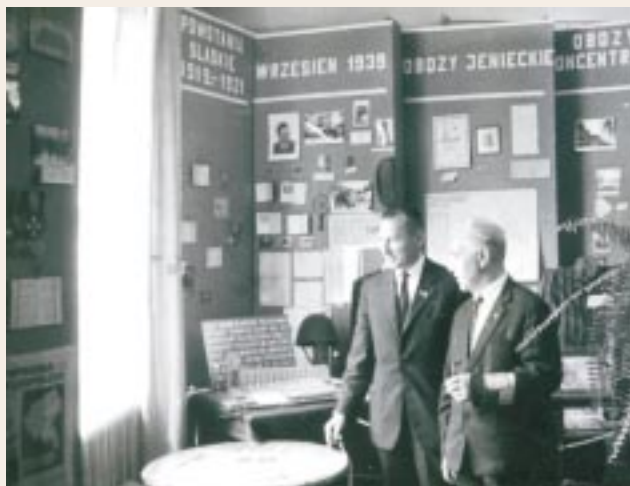
Wystawa „Historia więzi pokoleń” 16 maj 1970

Podsumowując te dwa pierwsze okresy działalności Kół Kombatanckich w Ursusie w latach 1946-1949 i 1949-1989 trzeba uznać wielki dorobek i osiągnięcia działaczy kombatanckich w Ursusie. Z wielkim szacunkiem oddaję hołd tym wszystkim, którzy mimo wieku i wielu kłopotów dążyli wytrwale do wspomnianych