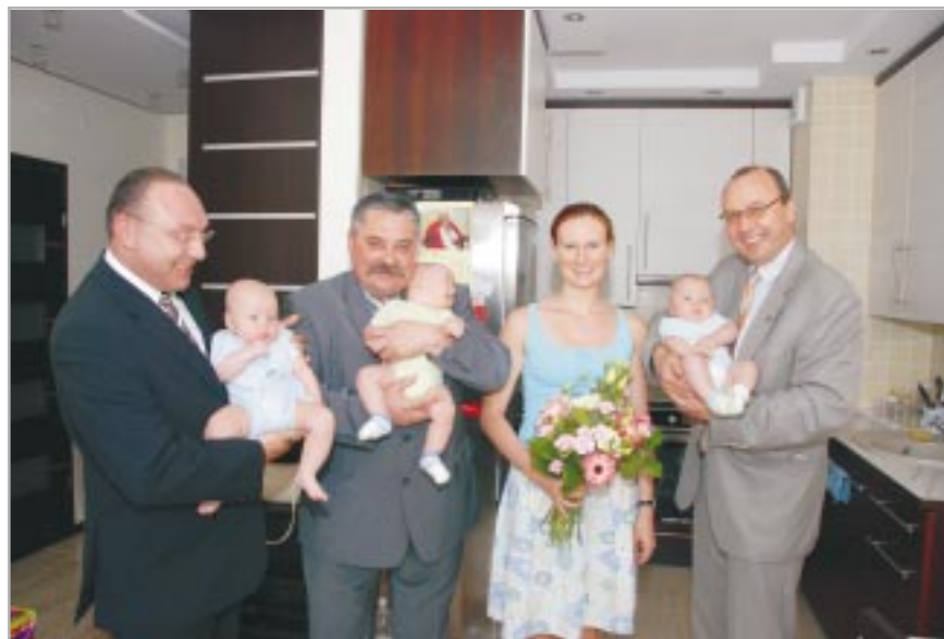
Zarząd Dzielnicy z trojaczkami