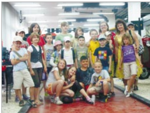
Wizyta w ZPC Ursus

Ursus tego lata po raz kolejny otworzył swoje drzwi dla dzieci. Letnia akcja cieszyła się ogromną popularnością. Liczba uczestników zajęć zorganizowanych przez Bibliotekę Publiczną wynosiła