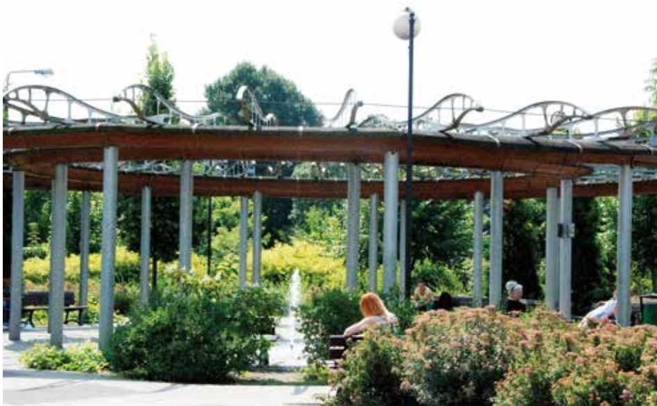
Fontanna na „Hasance”

Z uwagi na stan obiektu wcześniej należało wykonać prace remontowo-naprawcze polegające na wyburzeniu starej fontanny, wyłożeniu kamieniami misy, wymianie pompy oraz układu filtracji. Wymieniono również układ sterowania i zamontowano nową dyszę. Prace naprawcze i remontowe kosztowały ok. 12 000 zł. W związku z tym zwracamy się z prośbą do mieszkańców, by reagowali na wszelkie próby dewastowania obiektu. Szczególnie prosimy rodziców, aby zwracali uwagę na zabawy swoich pociech, gdyż wsypywanie kamieni, piachu, liści itp. rzeczy do wody grozi uszkodzeniem fontanny. Woda jest silnie chlorowana oraz zawiera dużą ilość środ-