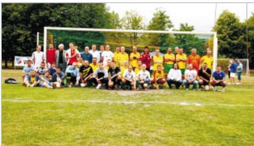
Drużyny RAP, Urzędu Dzielnicy i DDiOW

1 lipca na boisku przy Szkole Podstawowej nr 4 odbył się turniej piłki nożnej. Udział w nim wzięło 40 zawodników w 3 kategoriach wiekowych: szkoła podstawowa klasy 3-4, klasy 5-6 oraz gimnazja. W kategorii gimnazja wygrała drużyna Żółtych Ursusów, która w pierwszym meczu bezbramkowo zremi-