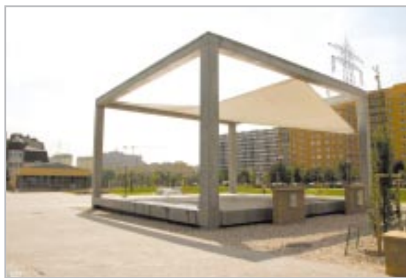
Scena w parku przy ul. Wojciechowskiego

Ponadto trwają prace termomodernizacyjne budynku przy ul. Sosnkowskiego 16 – Dom Kultury „Kolorowa”. Zostały zakończone prace projektowe przebudowy muszli koncertowej w Parku Czechowickim wraz z modernizacją otoczenia oraz budową pawilonu wystawowego. W miesiącu lipcu zostały podpisane umowy na wykonanie projektów wykonawczo-budowlanych na Dom Kultury „Arsus” II oraz halę widowiskowo-sportową przy ul. Dzieci Warszawy 42. Wykonywane są ogrodzenia zieleńców przy ul. Bony i Dzieci Warszawy (na tym zieleńcu remontowany jest także budynek gospodarczy). W tym roku planujemy rozpoczęcie prac projektowych na budowę żłobka przy ul. Czerwona Droga. W tym roku oddaliśmy do użytkowania plac zabaw w Szkole Podstawowej Nr 14 i Szkole Podstawowej Nr 4, dokończymy także plac zabaw przy Szkole Podstawowej Nr 11 oraz wykonamy II etap placu za-