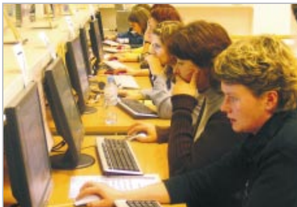
Studenci podczas zajęć

prowadzonych warsztatów w Bibliotece poświęconych porównaniu tożsamości Polaków i Turków na podstawie