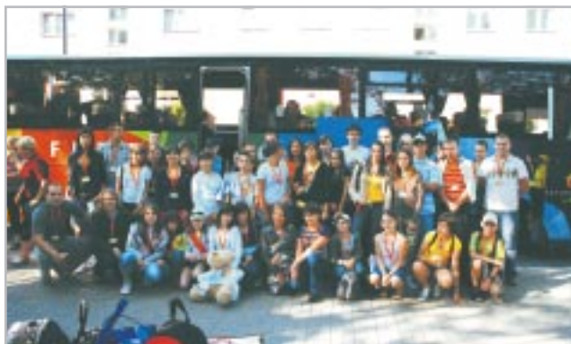
Wspólne zdjęcie uczestników

Za naszym pośrednictwem Towarzystwo Edukacji Alternatywnej serdecznie