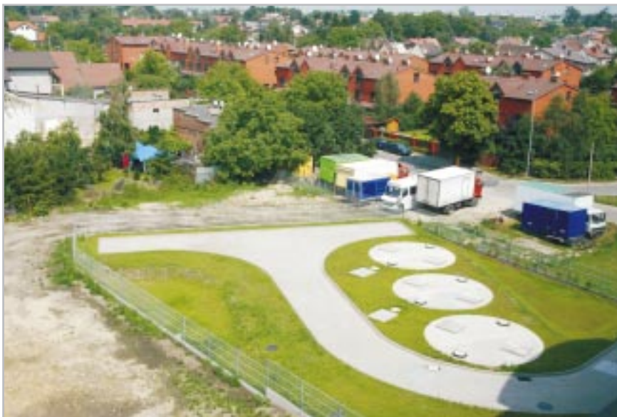
Widok podczyszczalni z góry

użytku podczyszczania znacznie obniży poziom zanieczyszczeń.