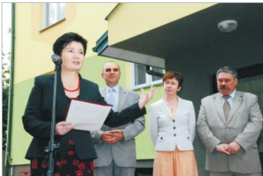
Hanna Gronkiewicz-Waltz z władzami dzielnicy

Drugą oddaną tego dnia inwestycją była podczyszczania wód opadowych