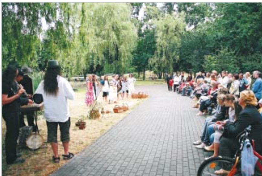
Nowatorski projekt młodzieży

plenerowych nad stawem Kiffera w parku Czechowickim. Nowatorski i