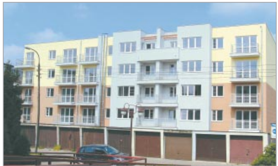
Nowy budynek komunalny czeka na lokatorów