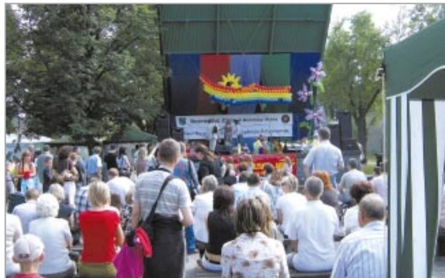
Inauguracja akcji „Lato w Mieście” w Parku Czechowickim

- Klub Młodzieżowy Warszawa-Ursus (ul. Boh. Warszawy 47) – warsztaty