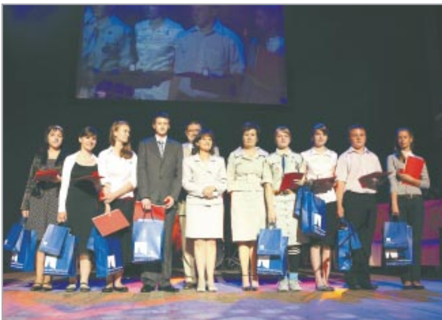
Tegoroczni laureaci w towarzystwie Prezydent m.st. Warszawy – Hanny Gronkiewicz-Waltz i Posłanki – Joanny Fabisiak

zyciowy optymizm i niezwykła wiara w ludzi. Z ogromnym zaangażowaniem podejmuje się różnych prac, zarówno tych domowych, jak i szkolnych, gdzie pełni funkcję przewodniczącej Samorządu Uczniowskiego.