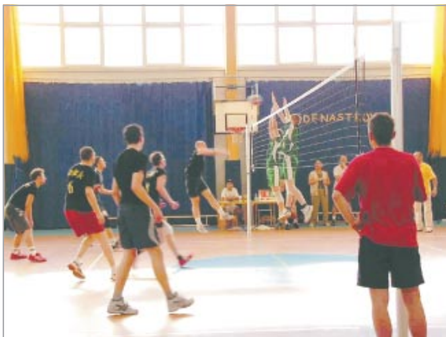
Na parkiecie Bad Boys Team i PKS Józef

słabszymi. W drugim półfinale PKS Józef pokonał 3:0 zespół „15-50”. 17 czerwca w hali sportowej Szkoły Podstawowej nr 11 zgromadziła się liczna widownia, która przyszła by dopingować swoich faworytów. A było na co