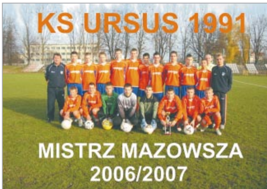
Drużyna w pełnym składzie.

Dobiegły końca rozgrywki Mazowieckiej Ligi Trampkarzy Starszych, w których naszą dzielnicę reprezentowała drużyna KS Ursus 1991.