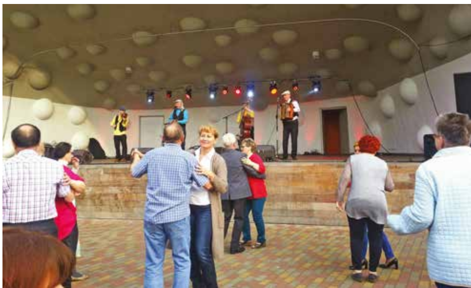
Tańczącym przygrywa Kapela Czerniakowska

Zapraszamy na kolejną potańcówkę. 20 czerwca w godz. 19.00–21.00 w Parku Czechowickim zagra Kapela z Targówka.