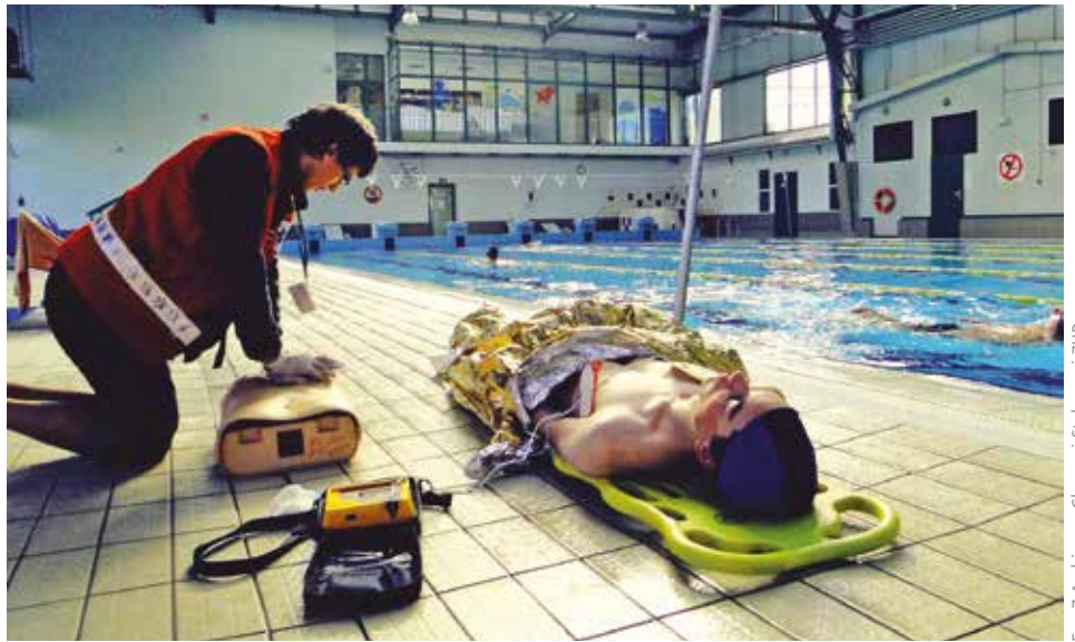
Udzielanie pierwszej pomocy

Mistrzostwa są doskonałą okazją dla grup ratowniczych jak również patroli złożonych z ratowników do sprawdzenia swoich umiejętności w realistycznie symulowanych wypadkach. Ważnym elementem mistrzostw jest pokazanie społeczności lokalnym iż pierwsza pomoc w wykonaniu ZHP to już nie jest bandażowanie fikcyjnych ran, złamań czy układanie poszkodowanego w pozycji bocznej, ale profesjonalnie podejście do te-