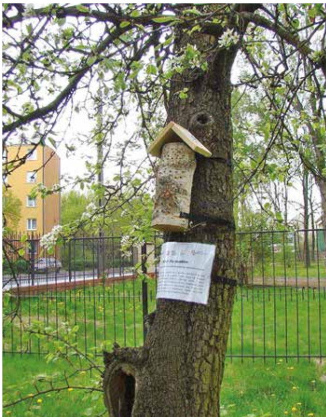
Domki dla owadów

Głównym celem projektu jest umożliwienie owadom złożenia jaj oraz przetrwanie zimowej hibernacji. Domki są przystosowa-