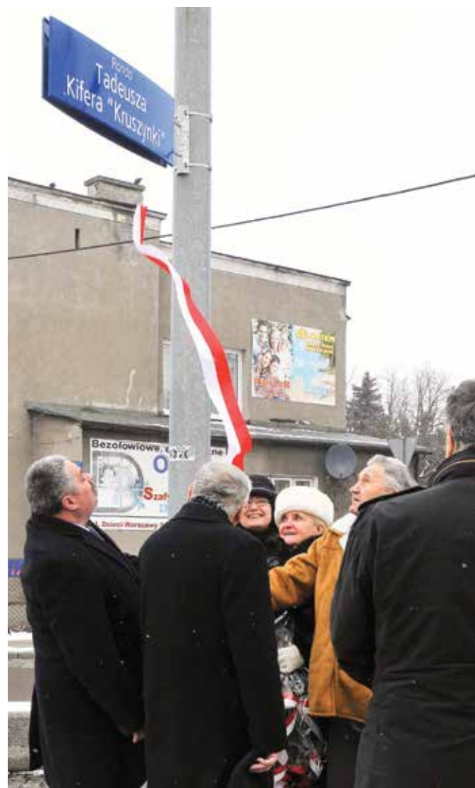
Moment zerwania wstęgi