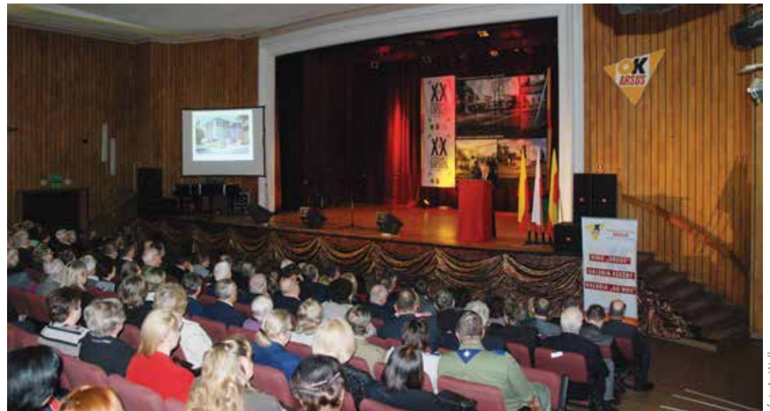
Uroczystość w Ośrodku Kultury „Arsus”

Po 20 latach sytuacja przedstawia się zgoła inaczej, lata konsekwentnej pracy w myśl zasady tzw. zrównoważonego rozwoju przynosi wymierne efekty. Obecnie Ursus zamieszkuje 53 tysiące ludzi, którzy mogą korzystać na co dzień z bogatej oferty kulturalno-sportowo-rekreacyjnej. Na terenie dzielnicy działa Ośrodek Kultury „Arsus” z dwoma filiami, kinem i Galerią „Ad-Hoc”, biblioteka, również z dwoma filiami, oraz Ośrodek Sportu i Rekreacji. Każda z jednostek stara się maksymalnie różnicować swoją ofertę, aby mieszkańcy mogli dowolnie realizować swoje zainteresowania i pasje. O potrzebie świadomego współfunkcjonowania lokalnego i samorealizacji świadczy około kilkudziesięciu organizacji pozarządowych tj. klubów, grup inicjatywnych i zespołów, które prężnie działają