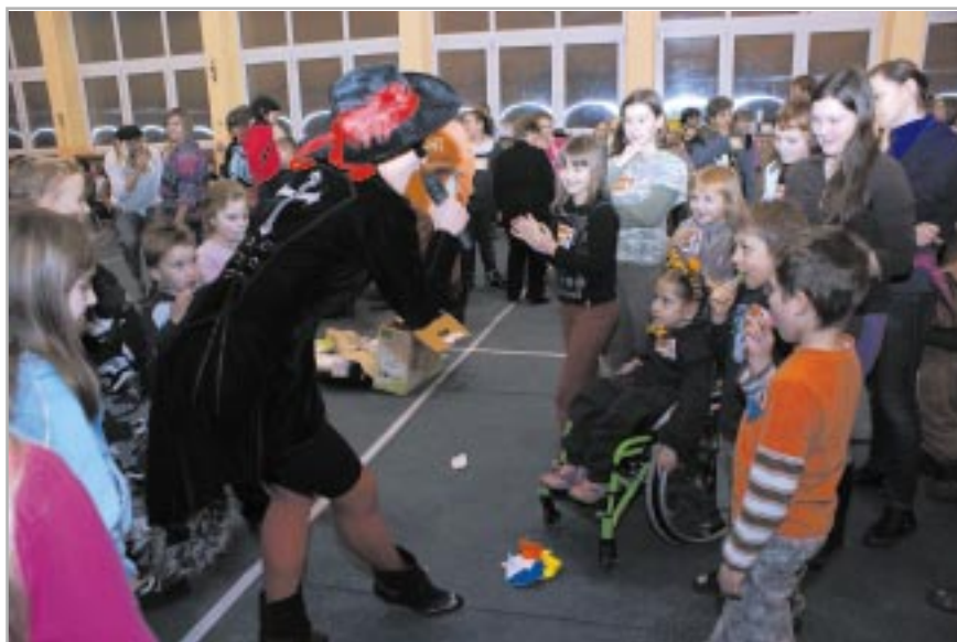
Zabawa z Kotem w butach