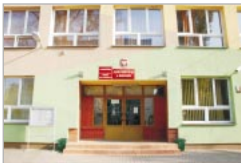
Zespół Szkół nr 42