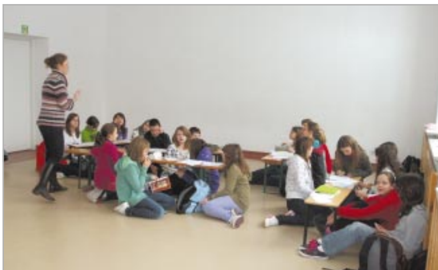
Warsztaty z udziałem uczniów