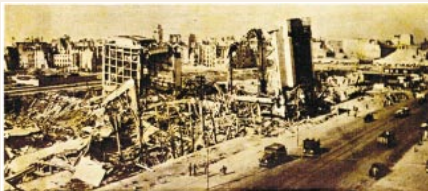
Wiosna 1945 rok – Al. Jerozolimskie – ruiny Dworca Głównego

Wkrótce ruszyła tak bardzo oczekiwana ofensywa wojsk sowieckich stojących w czasie Powstania Warszawskiego tuż za Wisłą. Dowództwo podjęło decyzję okrążenia Warszawy od południa i północy. Niemcy widząc swoje zagrożenie, 15 stycznia 1945 roku opuścili Warszawę uciekając wzdłuż szosy poznańskiej. Tego samego dnia w godzinach popołudniowych jednostki niemieckie opuściły również Zakłady Ursus i teren tzw. „centrali telefonicznej” przy obecnej ul. Sosnkowskiego róg ul. Kościuszki. W tym rejonie pozostały tylko oddziały, które miały do-