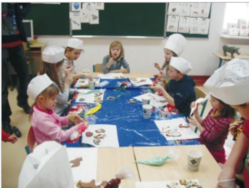
Zabawy z ciasteczkami

nalnego dzieci, podczas których nazywano i uświadamiano, dlaczego w danych sytuacjach zachowujemy się w